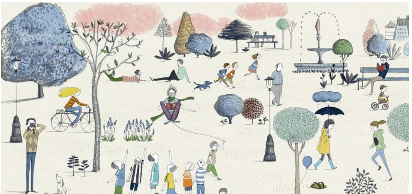
Moure, Gonzalo; Varela, Alicia. El arenque rojo . SM

Les imatges tenen un vocabulari, una sintaxi i una semàntica pròpia. Ens contenen a través de colors, estils, traços, perspectives i composicions.